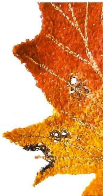
Itamar Yehiel; Maple; 2022

und Spannung, die zwischen dem alten Handwerk und den zeitgenössischen Kreationen besteht, erhöht, und dadurch zusätzlich bei den Betrachterinnen und Betrachtern Faszination und Neugierde weckt. Ganz besonders interessiert sich der Künstler für die Erforschung von Widersprüchen und Paradoxien, denen er sich eingehend widmet. Den Spannungen zwischen Realismus und Illusion, Organischem und Künstlichem, Temporärem und Ewigem, kommen dadurch als wesentliche Elemente seines kreativen Ausdrucks in nicht unerheblichem Maße Bedeutung zu, wenn sie durch Objekte aus der Natur sichtbar werden, die „stofflich“ zu neuem Leben erweckt wurden. Genau wie das historische Menschenhandwerk der Stickerei begreift Yehiel auch die vermittelnde Verwendung beim Einsatz der Natur als eine Art von globaler Sprache, die alle Individuen und Kulturen umfasst und ihre Wechselbeziehungen auch materiell und inhaltlich einbezieht. Diese Kunst Itamar Yehiels findet durch eine Vielzahl an Objekten, Farben, Formen und Texturen ihren Ausdruck, welche die tragenden Formulierungen seiner kreativen Sprache ausmachen und dadurch ein Füllhorn von Emotionen und Geschichten auf eine magische Art und Weise zu transportieren wissen.