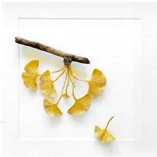
Itamar Yehiel; ginkgo branch in autumn; © Itamar Yehiel

Teilnahme an der ARTe Osnabrück, vom 3. bis zum 5. März 2023