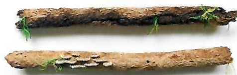
Itamar Yehiel; Decay; © Itamar Yehiel

Mit Leichtigkeit und Leidenschaft gelingt es Itamar Yehiel seitdem, mittels dieser Handwerkskunst moderne Geschichten durch ein traditionelles Handwerk zu kommunizieren. Seine abstrakten, vermeintlich schwebenden Objekte, verleihen der Natur in Verbindung mit der Kunst der Stickerei eine kreative Stimme, die man fühlen, sehen und deren Wirkung man im tiefen Inneren geradezu akustisch nachvollziehen kann. Die Kombination aus traditionellem Handwerk und modernen Materialien sowie seine daraus resultierende Sticktechnik